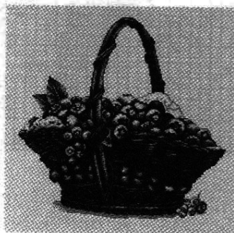
Схема сборки для схемы на страницах 9-11