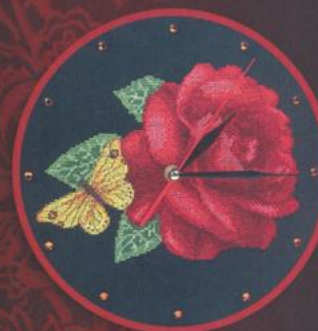
арт. М40008 (25x25 см) в составе набора часовой механизм со стрелками