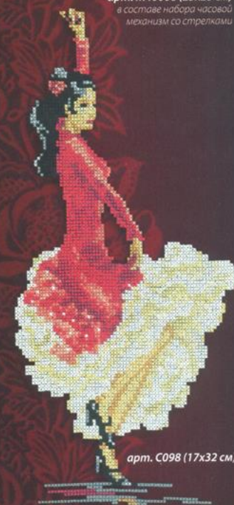
арт. С098 (17x32 см)